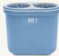
NU® pro Iceblue